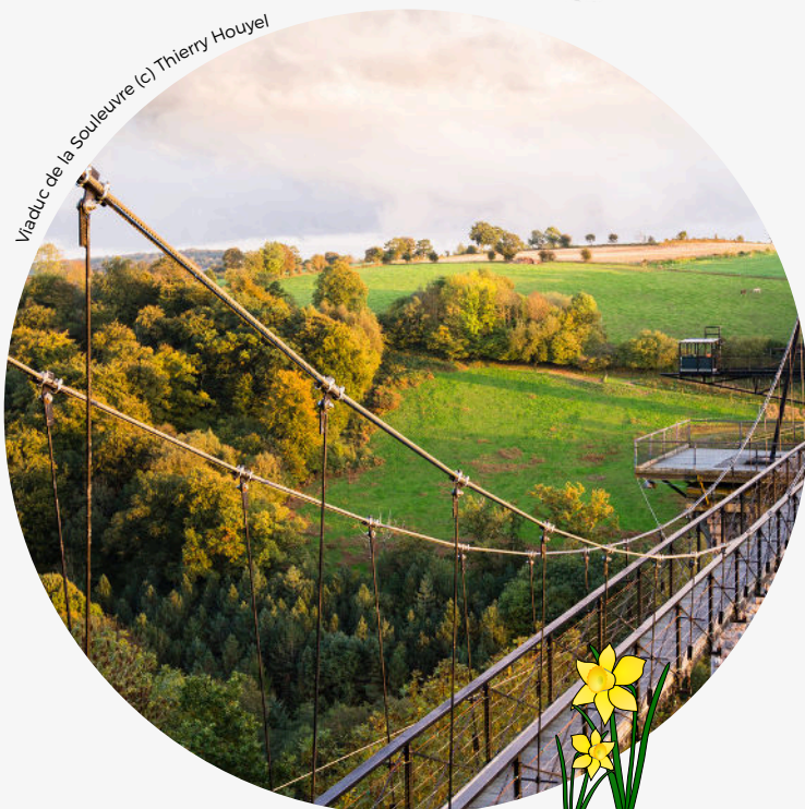
Viaduc de la Souleuvre