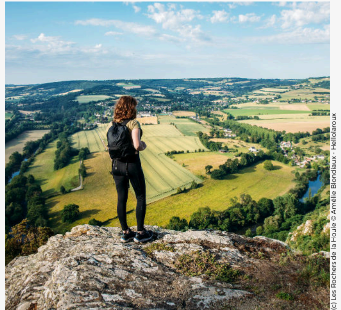
(c) Les Rochers de la Houle © Amélie Blondiaux - HelloLaroux

Deux dates sont prévues : le dimanche 25 mai et le samedi 7 juin infos et réservation obligatoire à l'adresse : lafermedurefuge@outlook.fr lafermedurefuge.fr